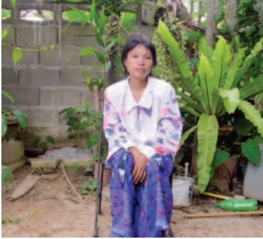
ก่อนการรักษา