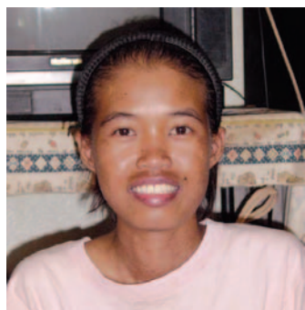
หลังการรักษา