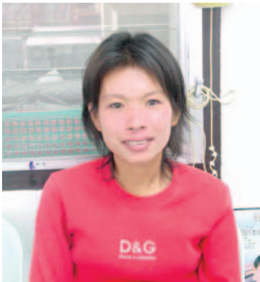
หลังการรักษา