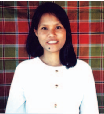
ภาพหลังการรักษา

เธอเป็นผู้หญิงอีกคนหนึ่งซึ่งโชค ร้ายที่ติดเชื้อเอดส์และวัณโรคจากสามี เมื่อสามีเสียชีวิตสุดากลับไปอยู่บ้าน พ่อแม่ของเธอ แล้ววันหนึ่ง เธอเกิด ป่วยหนักจนต้องเข้าโรงพยาบาล นอนป่วยอยู่ 4 วัน 3 คืน หมอก็บอก ว่า เธอถูกเชื้อวัณโรคฉวยโอกาส โจมตีร่างกายของเธอที่อ่อนแอจาก การติดเชื้อเอดส์ แต่หมอก็บอกเธอว่า วัณโรคปอดรักษาให้หายได้จึงควร รักษา เพราะจะช่วยให้เธอหายจาก อาการทรมาณต่าง ๆ ที่เกิดจาก วัณโรคได้ เช่น การไออย่างรุนแรง หอบ หายใจขัด และจะช่วยป้องกัน ไม่ให้คนที่อยู่ใกล้เธอติดเชื้อวัณโรค จากเธอด้วย