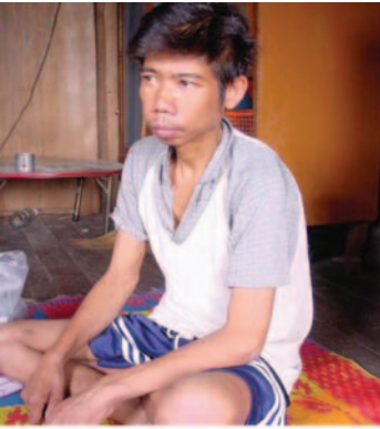
ก่อนการรักษา