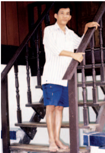
หลังการรักษา

เสนาะเป็นพ่อม่าย เขาเป็นอีกคนหนึ่งซึ่งติดเชื้อเอดส์แล้วป่วยเข้าโรงพยาบาลด้วยอาการหอบ ไอ เหนื่อย รักษาไม่ทันหายก็กลับบ้านก่อน ต่อมาโรงพยาบาลตรวจพบว่าเขาป่วยเป็นวัณโรคปอด โรงพยาบาลจึงตามเอายารักษาวัณโรคไปให้เขาที่บ้าน แนะนำให้เขากินยา แต่กินยาไปได้พักหนึ่ง ก็เกิดอาการแพ้ เขาจึงคิดจะหยุดกินยา เพราะรู้สึกว่ามันกินต่อไปไม่ไหว ร่างกายอ่อนเพลียมาก อาเจียนตลอด จนกินอะไรไม่ได้เลย