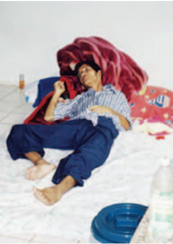
ก่อนการรักษา