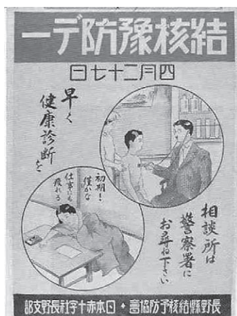
図3. 結核予防デーポスター。タイトル下に4月27日とある