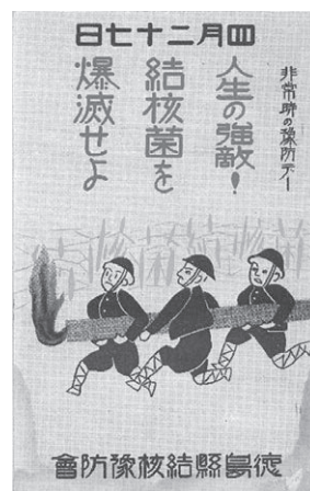
図2. 絵葉書