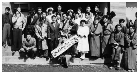
退院患者をお祝いで玄関で送り出す