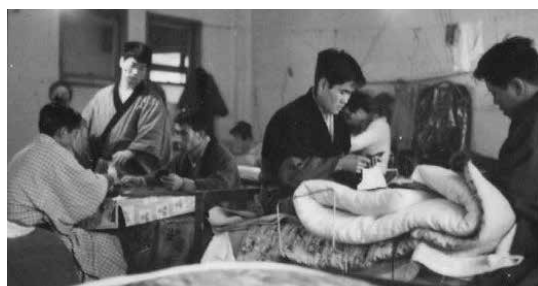
病室内で将棋やトランプに興じる様子